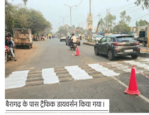
बैरागढ़ के पास ट्रैफिक डायवर्सन किया गया।