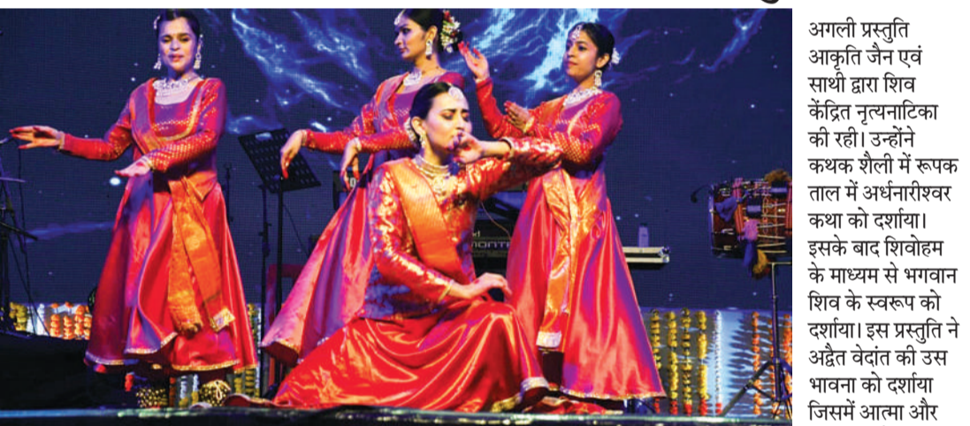
तीन दिवसीय महादेव भोजपुर महोत्सव के दूसरे दिन नृत्यनाटिका की प्रस्तुति देती कलाकार।