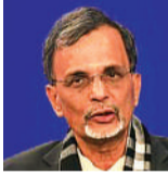
वी. अनंत नागेश्वरन

भारत के मुख्य आर्थिक सलाहकार वी. अनंत नागेश्वरन ने कहा कि एआई को अपनाने के लिए स्पष्ट रणनीति और बड़े पैमाने पर रोजगार के साथ तकनीकी को जोड़ने की प्रतिबद्धता जरूरी है। उन्होंने कहा कि देशों को निर्यातक कदम उठाते हुए मजबूत शिक्षा व्यवस्था, उच्च गुणवत्ता वाले कौशल विकास, श्रम-प्रधान सेवा क्षेत्रों का विस्तार और नियामकीय बाधाओं को दूर करने पर ध्यान देना होगा। एआई को अपनाने की प्रक्रिया एक सहयोगात्मक प्रयास होनी चाहिए, जिसमें निजी क्षेत्र, अकादमिक जगत और नीति-निर्माताओं की संयुक्त भागीदारी जरूरी है। एआई अपनाने का अवसर अभी खुला है, लेकिन यह हमेशा के लिए नहीं रहेगा, इसलिए तेजी और तत्काल कार्रवाई की जरूरत है।