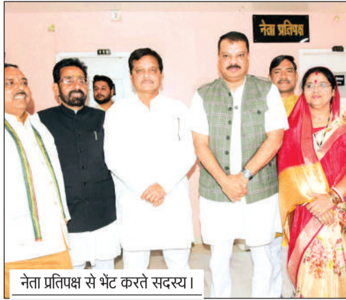
नेता प्रतिपक्ष से भेंट करते सदस्य।