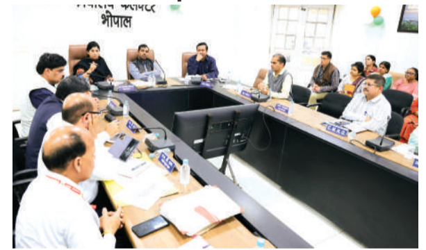
टाइम लिमिट बैठक में चर्चा करते अधिकारी।