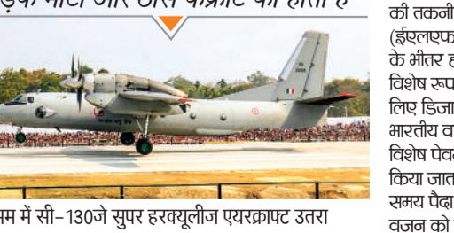
असम में सी-130जे सुपर हरक्यूलीज एयरक्राफ्ट उतरा

असम के डिब्रुगढ़ में शनिवार (15 फरवरी) को मोगान बायपास पर इमरजेंसी लैंडिंग फैसिलिटी (ईएलएफ) के सफल परीक्षण के साथ भारत ने अपने सीमाई इलाकों पर बड़ी रणनीतिक बढ़त हासिल कर ली है। दरअसल, इस हाईवे पर भारतीय वायुसेना का सी-130जे सुपर हरक्यूलीज एयरक्राफ्ट उतरा है, जो कि अपने वर्ग में सबसे बड़े सैन्य विमानों में से एक है। इसमें पीएम नरेंद्र मोदी भी सवार थे। रक्षा विशेषज्ञों की मानें तो भारत की ओर से जिस तरह से अब पूर्वोत्तर में भी एक हाईवे को विमानों के रनवे के तौर पर इस्तेमाल किया है, यह चीन के लिए बड़ा सिरदर्द बन सकता है।