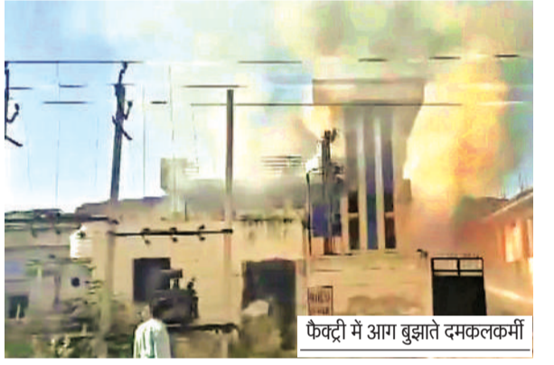
फैक्ट्री में आग बुझाते दमकलकर्मी

पहले अभिभाषण सुन लें, सबको मौका मिलेगा कांग्रेस के हंगामा शुरू करने के दौरान विधानसभा अध्यक्ष नरेंद्र सिंह तोमर ने कांग्रेसी सदस्यों से अनुरोध किया कि वे राज्यपाल का अभिभाषण पहले सुनें, यदि उनकी कोई बात होगी तो सदन में उन्हें पर्याप्त समय मिलेगा, इस दौरान अपनी बात कह सकते हैं। किंतु कांग्रेस सदस्यों ने उनकी बात अनसुनी करते हुए शोरगुल व हंगामा करते रहे। कांग्रेस सदस्यों ने अध्यक्ष ने उनका माइक बंद करने का भी आरोप लगाया। यह सब करीब 11.28 मिनट तक चलता रहा। इसके बाद उन्होंने अभिभाषण का अंतिम पंक्ति कहकर समाप्त कर दिया। हालांकि राज्यपाल को सदन से विदा >>> शेष पेज 4 पर