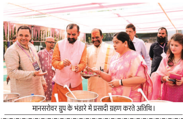
मानसरोवर ग्रुप के भंडारे में प्रसादी ग्रहण करते अतिथि।

भोपाल। कोलार रोड स्थित मानसरोवर ग्रुप ऑफ इंस्टीट्यूशंस में आयोजित दो दिवसीय महाशिवरात्रि महापर्व का समापन श्रद्धा और उल्लास के साथ संपन्न हुआ। मानसरोवरेश्वर महादेव मंदिर परिसर में आयोजित इस उत्सव के दूसरे दिन आयोजित विशाल भंडारे में भक्तों की भारी भीड़ देखने को मिली। अखंड रामायण पाठन, भजन