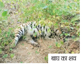
बाघ का शव

तीन दिनों से बाघ की लोकेशन एक ही स्थान पर मिल रही थी, तब शक हुआ