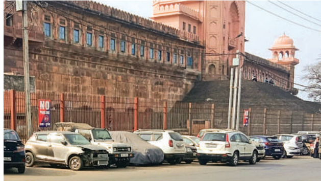
जुमाने के बोर्ड के पास खड़े कंडम और चलित वाहन।

स्थानीय दुकानदारों का कहना है कि सड़क निर्माण के बाद से ही यहां अव्यवस्थित पार्किंग की समस्या बनी हुई है, लेकिन अब तक कोई ठोस और नियमित कार्रवाई नहीं की गई। सड़क के दूसरी तरफ ट्रैफिक पुलिस नियमित रूप से चालान काटती है, लेकिन नो-पार्किंग जोन में खड़े वाहनों पर सख्ती न होने से नियमों की गंभीरता कम होती दिखाई दे रही है। नागरिकों का कहना है कि शहर की पहचान स्थल के सामने इस प्रकार की अव्यवस्था प्रशासन की छवि को धूमिल कर रही है। उन्होंने मांग की है कि नियमित निगरानी, सख्त कार्रवाई और वैकल्पिक पार्किंग व्यवस्था सुनिश्चित की जाए।