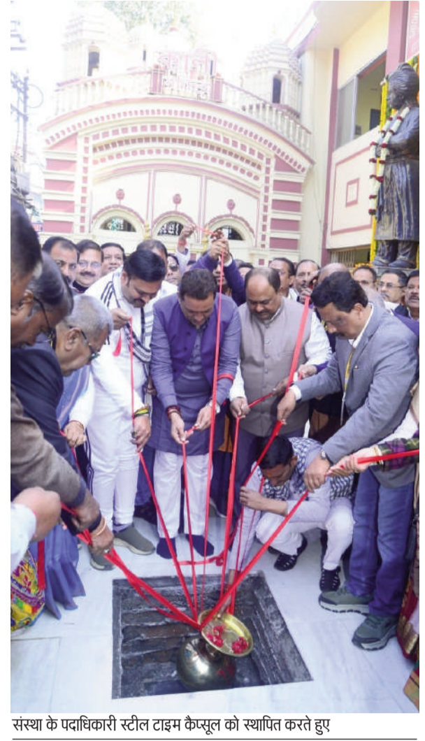
संस्था के पदाधिकारी स्टील टाइम कैप्सूल को स्थापित करते हुए

मंदिरों व भवनों के चित्र, शताब्दी समारोह के फोटो-वीडियो तथा सभी अभिलेखों की साँफ कॉपी पेन ड्राइव में संचित की गई है। यह टाइम कैप्सूल आने वाले 200 वर्षों तक सुरक्षित रखे जाने के उद्देश्य से तैयार किया गया है, ताकि भविष्य की पीढ़ियां संस्था की विरासत और योगदान को जान सकें। सिटी बंगाली क्लब की यह पहल जबलपुर ही नहीं, बल्कि प्रदेश के सांस्कृतिक इतिहास में एक महत्वपूर्ण उपलब्धि मानी जा रही है।