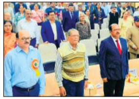
हरिभूमि न्यूज़ ॥ भोपाल