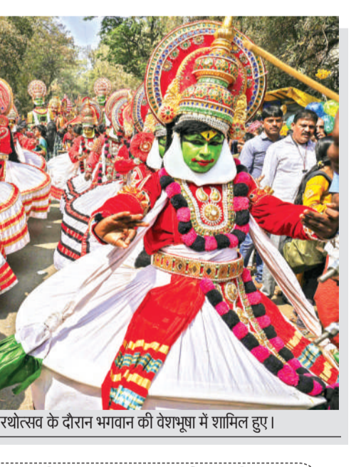
मलेशरम। फोक कलाकार मालेशरम में रथोत्सव के दौरान भगवान की वेशभूषा में शामिल हुए।