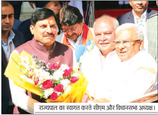
राज्यपाल का स्वागत करते सीएम और विधानसभा अध्यक्ष।

राज्यपाल पटेल ने अपने अभिभाषण में मुख्यमंत्री डॉ. मोहन यादव सरकार की उपलब्धियों, विकास योजनाओं और राज्य की प्रगति की गाथा सुनाई। अभिभाषण के बाद कृतज्ञता प्रस्ताव पेश किया गया, जिस पर बजट पेश करने के बाद चर्चा होगी। उप मुख्यमंत्री एवं वित्त मंत्री जगदीश देवड़ा 2026-27 का बजट पेश करेंगे। यह बजट पेपरलेस (डिजिटल) होगा। सत्र के दौरान कुल 12 बैठकें प्रस्तावित हैं।