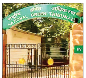
सीधे हरदा कलेक्टर करदेंगे सुनवाई

हरदा पटाखा फैक्ट्री विस्फोट मामले में एनजीटी ने पीड़ितों के पुनर्वास और अतिरिक्त मुआवजे को लेकर अहम हस्तक्षेप किया है। सेंट्रल जोन बेंच ने निर्देश दिया है कि घमाके में गंभीर रूप से घायल और स्थायी दिव्यांगता झेल रहे लोगों की स्थिति की पुष्टि के लिए विशेष मेडिकल बोर्ड का गठन किया जाए। सुनवाई के दौरान राज्य सरकार की ओर से ट्रिब्यूनल को बताया गया कि पीड़ितों को मुआवजे को बड़ी राशि पहले ही वितरित की जा चुकी है और संबंधित दस्तावेज भी प्रस्तुत किए गए। वहीं, पीड़ित पक्ष ने दलील दी कि दो गई राशि नुकसान और स्थाई चोटों की तुलना में पर्याप्त नहीं है। कई घायलों को लंबे इलाज और स्थाई शारीरिक अक्षमता का सामना करना पड़ रहा है, जिसके लिए अतिरिक्त सहायता आवश्यक है।