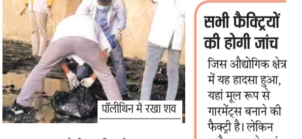
पॉलीथिन में रखा शव