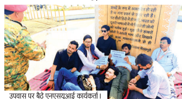
उपवास पर बैठे एनएसयूआई कार्यकर्ता।