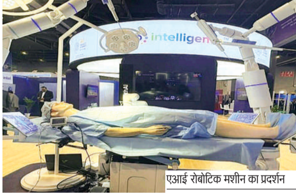
एआई रोबोटिक मशीन का प्रदर्शन

केंद्रीय मंत्री जितिन प्रसाद ने कहा कि पांच दिवसीय एआई इम्पैक्ट समिट में दुनियाभर के नेता, स्टार्टअप, नवोन्मेषक और शोधकर्ता एकत्र हुए