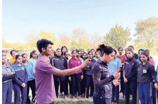
हरिभूमि न्यूज़ ॥ भोपाल

प्रधानमंत्री उच्चतर शिक्षा अभियान के अंतर्गत शारीरिक शिक्षा विभाग, बरकतुल्लाह विश्वविद्यालय में महिला आत्मरक्षा प्रशिक्षण कार्यक्रम का सोमवार को शुभारंभ