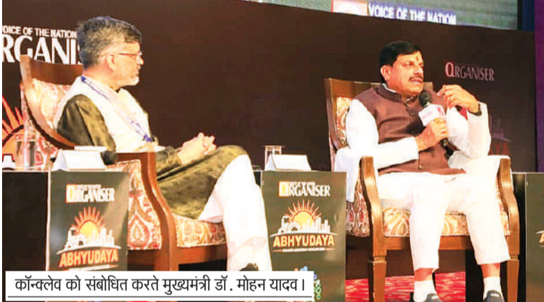
कॉन्क्लेव को संबोधित करते मुख्यमंत्री डॉ. मोहन यादव।