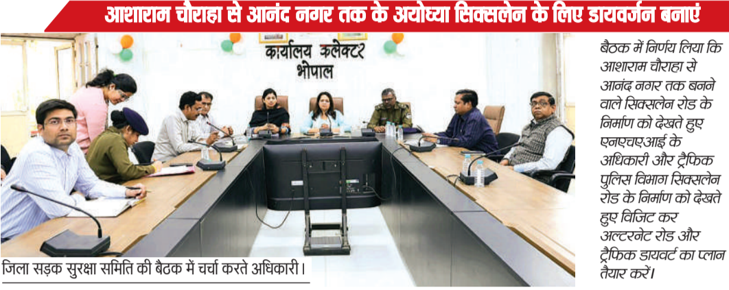
जिला सड़क सुरक्षा समिति की बैठक में चर्चा करते अधिकारी।

जिला सड़क सुरक्षा समिति की बैठक में दी गई जानकारी