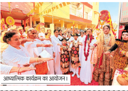
आध्यात्मिक कार्यक्रम का आयोजन।