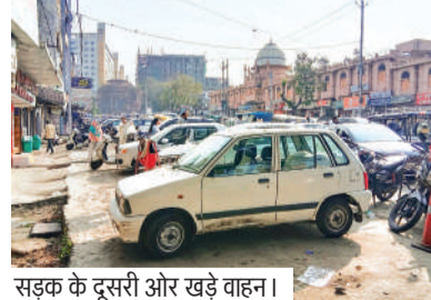
सड़क के दूसरी ओर खड़े वाहन।

स्थानीय दुकानदारों का कहना है कि सड़क निर्माण के बाद से ही यहां अव्यवस्थित पार्किंग की समस्या बनी हुई है, लेकिन अब तक कोई ठोस और नियमित कार्रवाई नहीं की गई। सड़क के दूसरी तरफ ट्रैफिक पुलिस नियमित रूप से चालान काटती है, लेकिन नो-पार्किंग जोन में खड़े वाहनों पर सख्ती न होने से नियमों की गंभीरता कम होती दिखाई दे रही है। नागरिकों का कहना है कि शहर की पहचान स्थल के सामने इस प्रकार की अव्यवस्था प्रशासन की छवि को धूमिल कर रही है। उन्होंने मांग की है कि नियमित निगरानी, सख्त कार्रवाई और वैकल्पिक पार्किंग व्यवस्था सुनिश्चित की जाए।