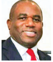
डिप्टी पीएम डेविड लेमी