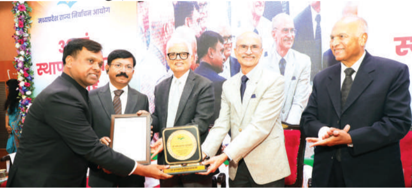
हरिभूमि न्यूज़ ॥ भोपाल

बीएलओ से लेकर चीफ इलेक्शन ऑफिसर तक सभी इलेक्शन कमीशन हैं। निर्वाचन में सभी की भूमिका महत्वपूर्ण होती है। भारत निर्वाचन आयोग के पूर्व मुख्य निर्वाचन आयुक्त ओ.पी. रावत ने यह बात सोमवार को प्रदेश राज्य निर्वाचन आयोग के 32वें स्थापना दिवस समारोह में कही। रावत ने वन नेशन-वन इलेक्शन में स्थानीय निर्वाचन की भूमिका विषय पर बोलते हुए कहा कि इस पर चर्चा 2015 में शुरू हुई थी। भारत निर्वाचन आयोग द्वारा इसमें सहमति व्यक्त की गयी थी। रावत ने कहा कि वन नेशन-वन इलेक्शन को लागू करने पर भी राज्य निर्वाचन आयोग जरूरी होंगे। पंचायत एवं नगरीय निकाय चुनाव इनके माध्यम ही होना चाहिए। उन्होंने कहा कि पूरी उम्मीद है कि वन नेशन-वन इलेक्शन का ड्राफ्ट जरूर मंजूर होगा। रावत ने माडल कोड ऑफ कंडक्ट के बारे में भी विस्तार से चर्चा की।