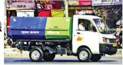
निगम के वाहन से पेट्रोल चोरी करना का एक वीडियो सोमवार को सोशल मीडिया पर वायरल हुआ। यह वीडियो एम्पी नगर क्षेत्र में किसी वाहन चोरों के आसपास का बताया जा रहा है। वीडियो में कुछ लोग वाहन के पीछे टैंक की तरफ खड़े होकर पेट्रोल निकालते नजर आ रहे हैं।

नगर निगम में लगे एक चार पहिया वाहन से पेट्रोल चोरी करने घटनाएं लगातार सामने आ रही हैं। ऐसा ही एक मामला विगत दिनों सामने आया।