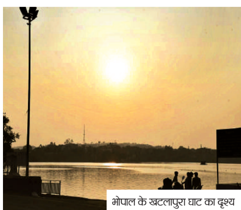
भोपाल के खटलापुरा घाट का दृश्य

राजधानी सहित प्रदेश के अधिकांश जिलों में कल के बाद मौसम फिर बदलेगा। गुरुवार से शनिवार के बीच भोपाल-इंदौर संभाग सहित कई जिलों में बादल और कुछ जगह बारिश होगी। इससे पहले बुधवार रात से प्रदेशभर में न्यूनतम तापमान में वृद्धि शुरू हो जाएगी। भोपाल में अभी दिन-रात का पारा सामान्य के करीब है, जो गुरुवार तक 2 से 3 डिग्री तक बढ़ेगा। प्रदेश में औसत न्यूनतम पारा भी दो डिग्री तक बढ़ने की उम्मीद है। दिन में कुछ कमी आएगी। मौसम केंद्र के अनुसार अभी ज्यादा बदलाव की उम्मीद नहीं है। दो दिन बाद रात के तापमान में बढ़त ►►शेष पेज 4 पर