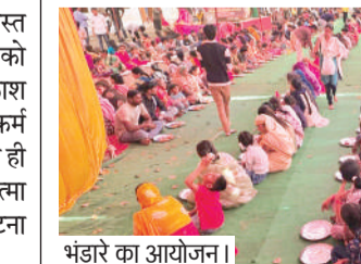
भंडारे का आयोजन।

भोपाल। श्री पशुपतिनाथ नेपाली समाज, गोविंदपुरा में महाशिवरात्रि के पावन पर्व के दूसरे दिन तक भंडारे का आयोजन किया गया। इस मौके पर हजारों भक्तजनों ने महाप्रसादी ग्रहण किया। इस साल समाज ने पर्यावरण संरक्षण के तहत प्लास्टिक हटाओ, पर्यावरण बचाओ अभियान चलाया। समाज ने मंदिर परिसर में प्लास्टिक कचरे को हटाने और पर्यावरण को स्वच्छ रखने की