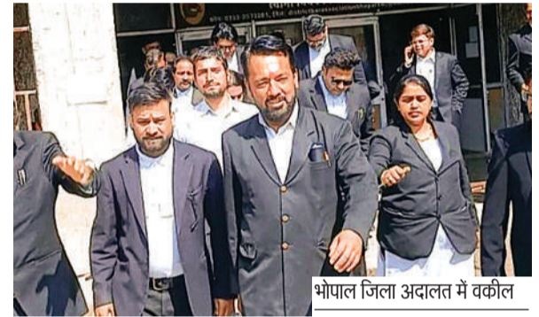
भोपाल जिला अदालत में वकील