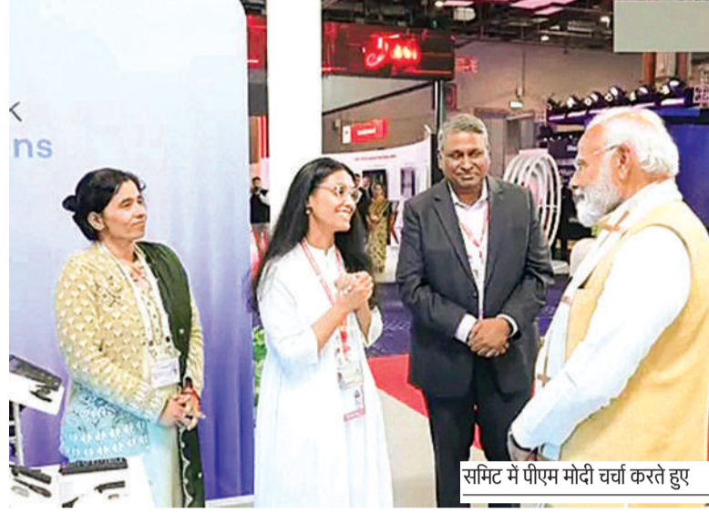
समिट में पीएम मोदी र्वा करते हुए