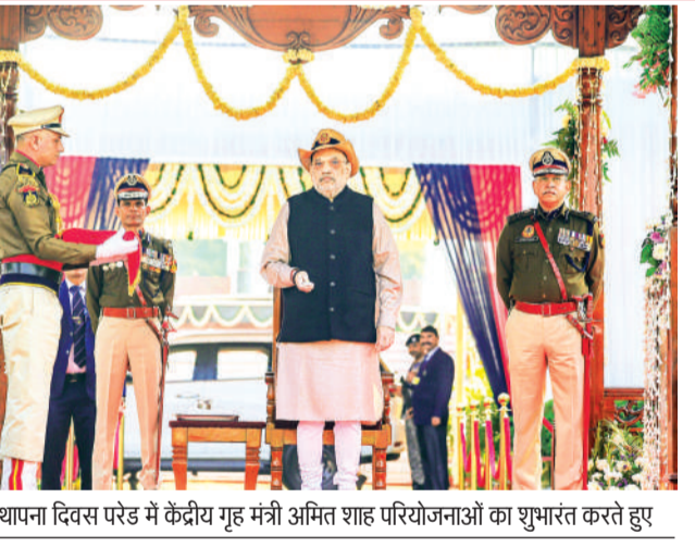
स्थापना दिवस पर 20 दिनों में केंद्रीय गृह मंत्री अमित शाह परियोजनाओं का शुभारंभ करते हुए